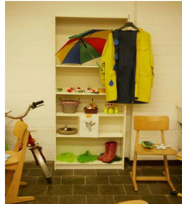
Eine Schülerpräsentation zum April

Zu jedem Monat des Jahres haben die Schülerinnen und Schüler geforscht und ihre Ergebnisse kreativ zu einem Kunstwerk gestaltet.